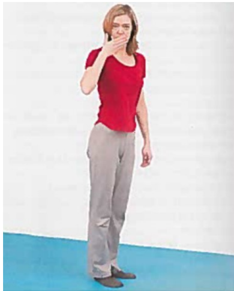
Abb.: Husten im Stand