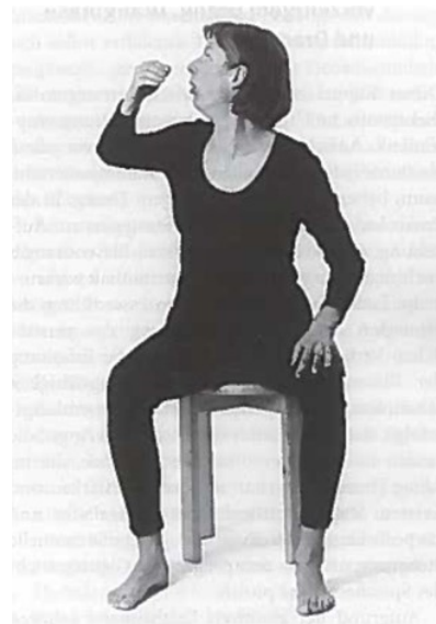
Abb.: Husten im Sitz